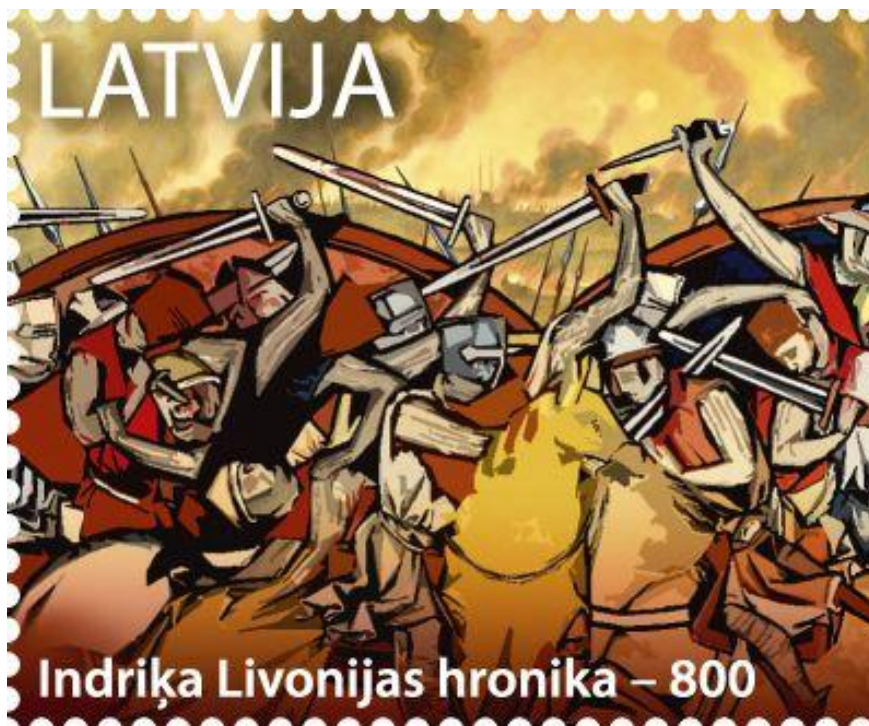
Latvijas Pasts iezīmē Latvijas rakstītās vēstures liecību sākumpunktu pastmarkā