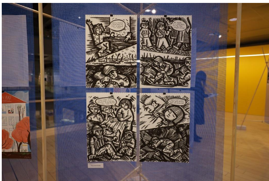
Ukrainiņu mākslinieku grupas "Pictoric" izstāde "Safe place. Drošā vieta"